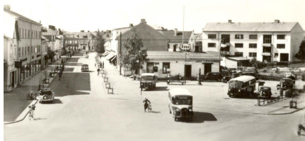
Gamla Busstationen och Taxi i Boden